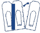
Détacher un suppositoire selon les pointillés

Ce médicament est utilisé par voie rectale.